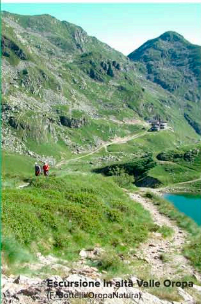
Escursione in alta Valle Oropa

«Le Alpi dal M. Bianco al Lago Maggiore» (Guide Geologiche Regionali, BE-MA editrice)