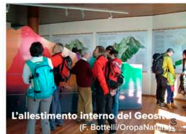
L'allestimento interno del Geosito