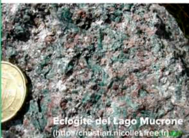
Eclogite del Lago Mucrone