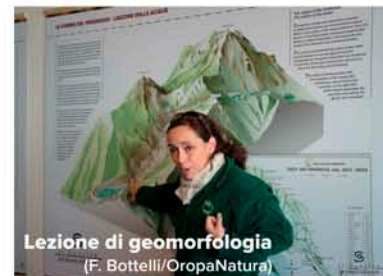
Lezione di geomorfologia

Siccome i fenomeni geologici sono spesso difficilmente percepibili , alcune simulazioni presentano i paesaggi ipotetici che si sono susseguiti negli ultimi 2,6 milioni di anni , durante i quali le Alpi sono state interessate più volte dallo sviluppo di ghiacciai, che ne hanno profondamente modificato l'aspetto.